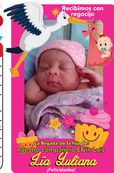
Imagen Personal en el Trabajo

A la hora de trabajar, la primera impresión es crucial para muchos aspectos en el futuro, y es que, como dice el refrán, una imagen vale más que mil palabras.